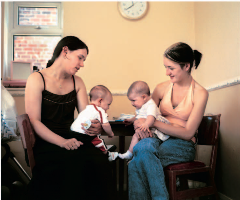
Europeanen moeten gestimuleerd worden meer kinderen te krijgen, zodat de vergrijzing betaalbaar blijft.

migranten nodig om de verhouding tussen jong en oud constant te houden." Maar immigranten worden natuurlijk wel oud. Uit de berekeningen van de Verenigde Naties blijkt dat in dat geval de EU meer dan 700 miljoen immigranten nodig heeft. "Het mag duidelijk zijn dat immigratie geen antwoord is."